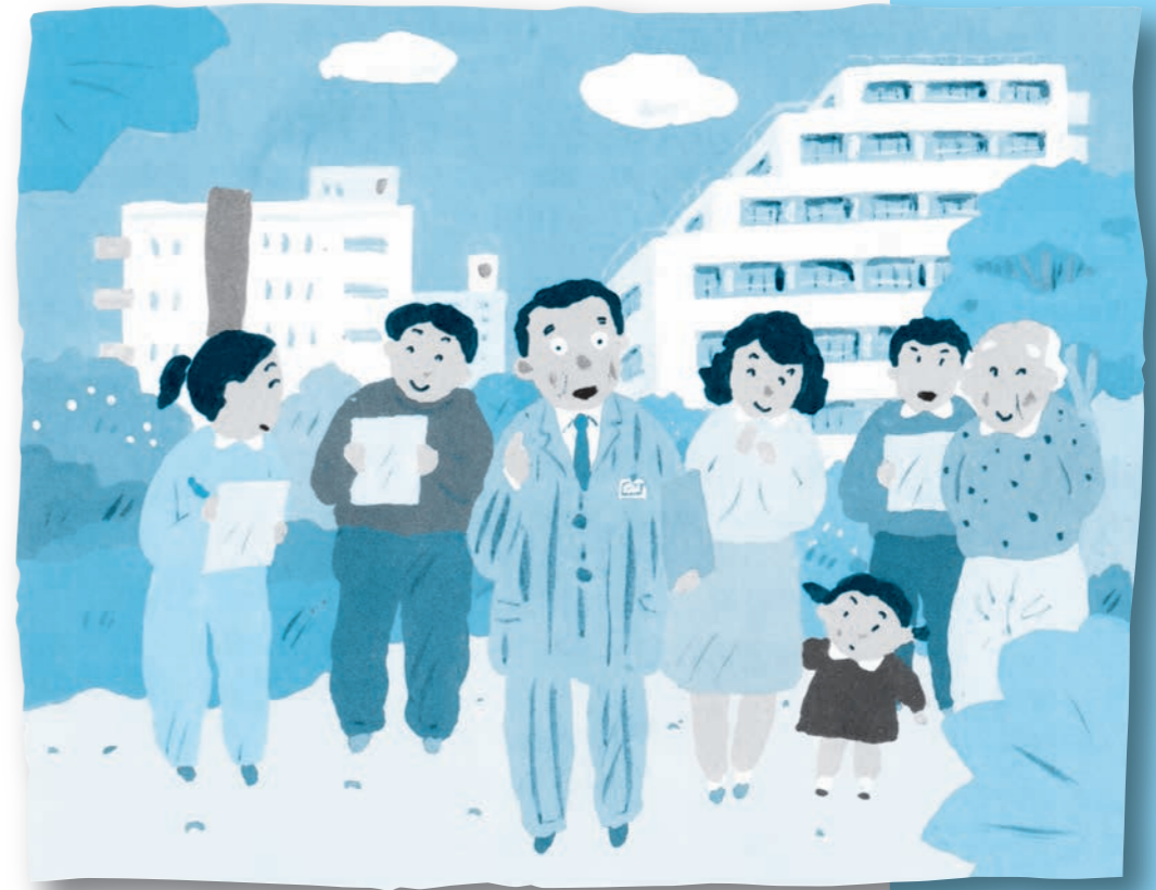
〔横浜市住宅供給公社〕