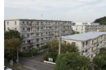
←磯子レインボーハイツは築34年で3回目の大規模修繕工事を行っている